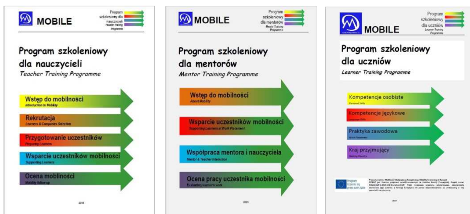
Rys. 1, 2, 3. Oferowane programy szkoleniowe